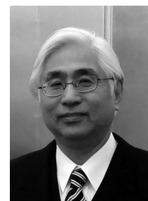
Проф. Кенджи Омаса

Ассоциация JAICABE, которая объединяет десять обществ, реализовывает мероприятия СИГР при поддержке SCJ. JAICABE и отдельные члены указанных десяти обществ получают много пользы от Информационных бюллетеней СИГР. С 2006 года JAICABE оказывала поддержку деятельности Генерального секретариата СИГР в издании Информационного бюллетеня, поддерживала мероприятия СИГР,