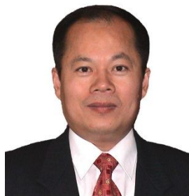
Проф. Да-Вен Сан

Сердечно приветствую всех тех, кто сейчас читает этот специальный выпуск Информационного бюллетеня СИГР и присоединяется к нам в праздновании выхода в свет 100-го выпуска Информационного бюллетеня СИГР.