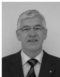
Проф. Сорен Педерсен

Я надеюсь, что в последующие десятилетия СИГР будет продолжать развиваться и сохранит передовую позицию в сфере обмена полученными научными результатами, как